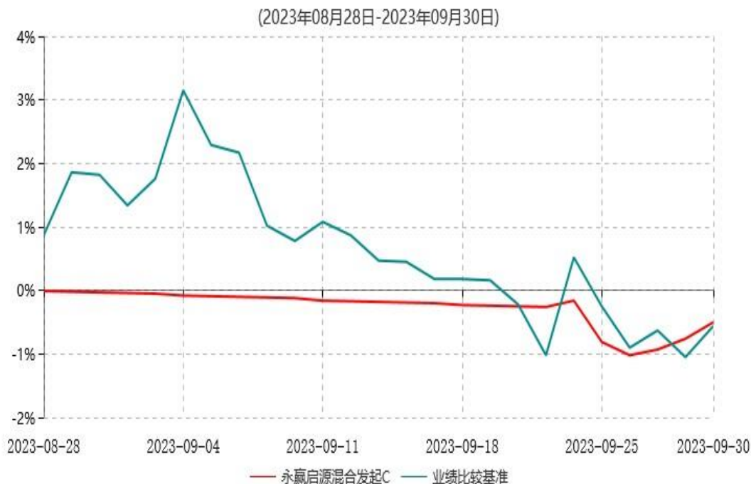
永赢启源混合发起C累计净值增长率与业绩比较基准收益率历史走势对比图