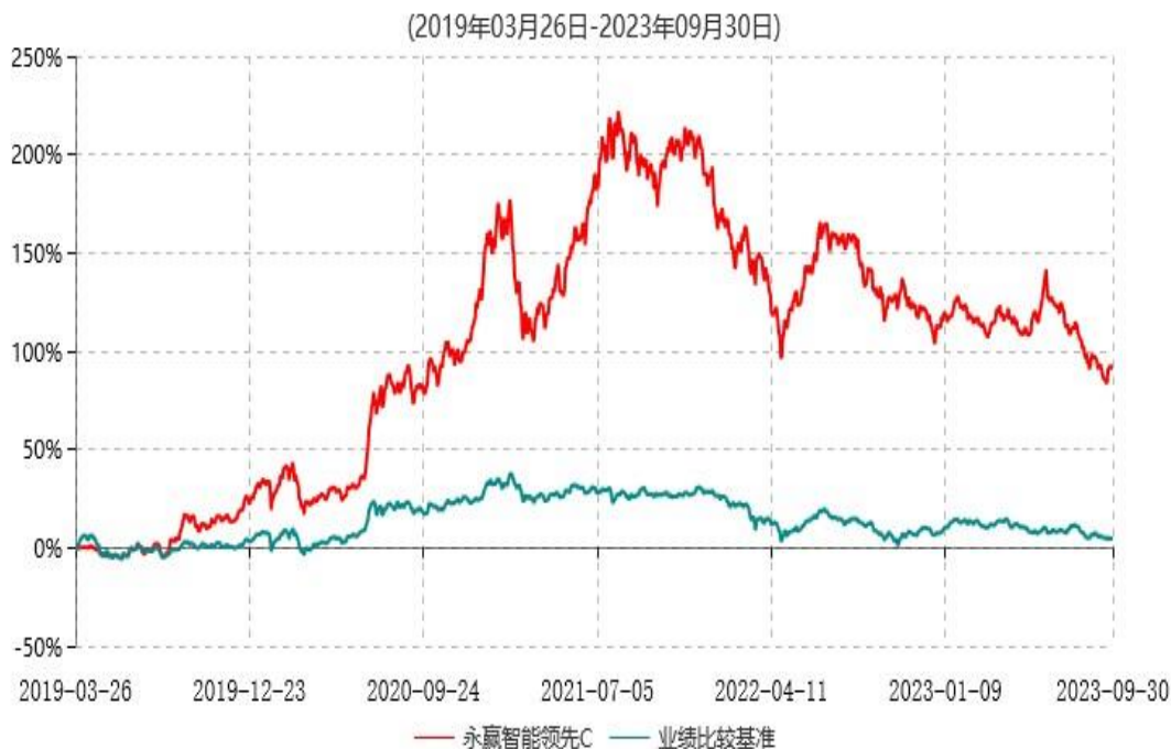
永赢智能领先C累计净值增长率与业绩比较基准收益率历史走势对比图