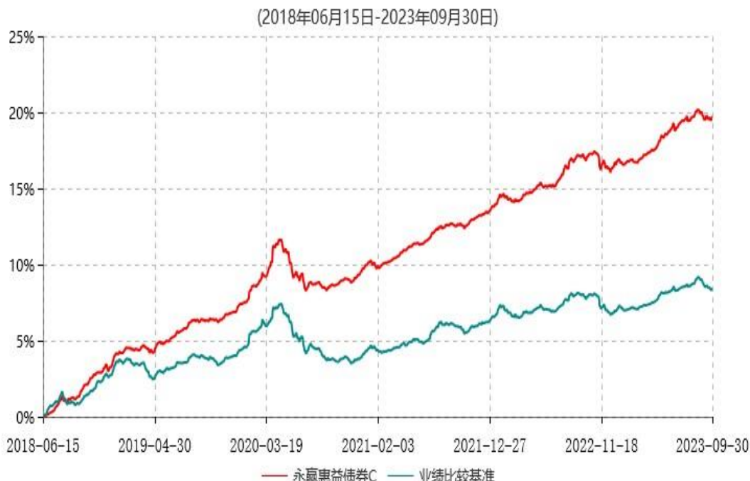
永赢惠益债券C累计净值增长率与业绩比较基准收益率历史走势对比图