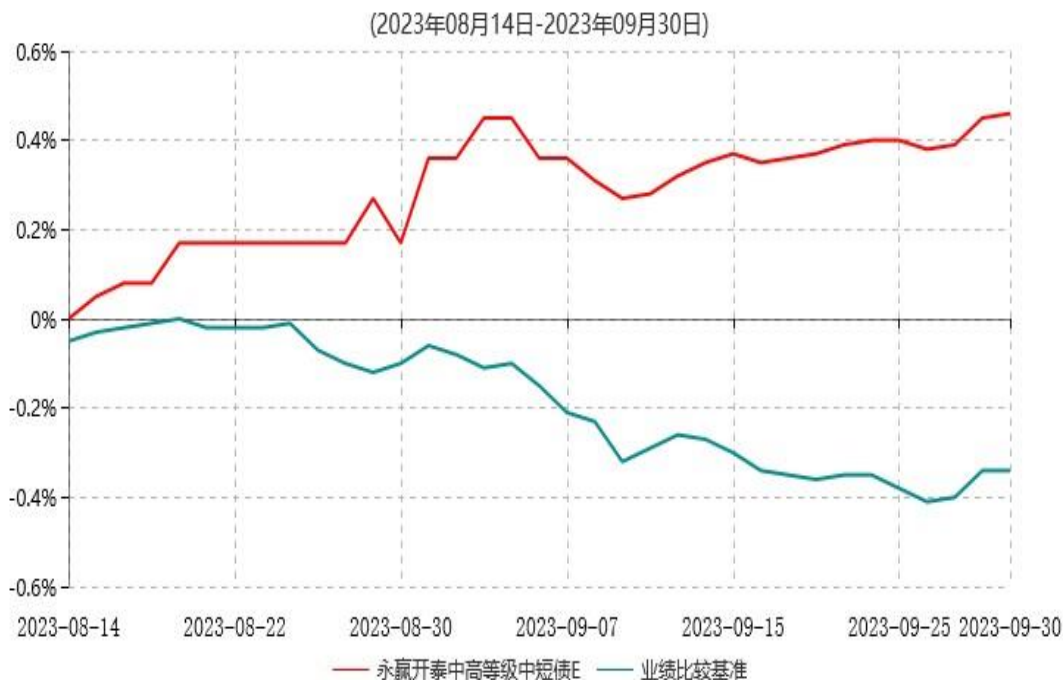
永赢开泰中高等级中短债E累计净值增长率与业绩比较基准收益率历史走势对比图

注：本基金自 2023 年 08 月 14 日增设 E 类份额，截至本报告期末，本类基金份额生效未满一年。