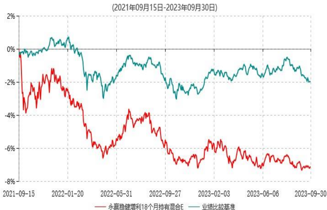
永赢稳健增利18个月持有混合E累计净值增长率与业绩比较基准收益率历史走势对比图