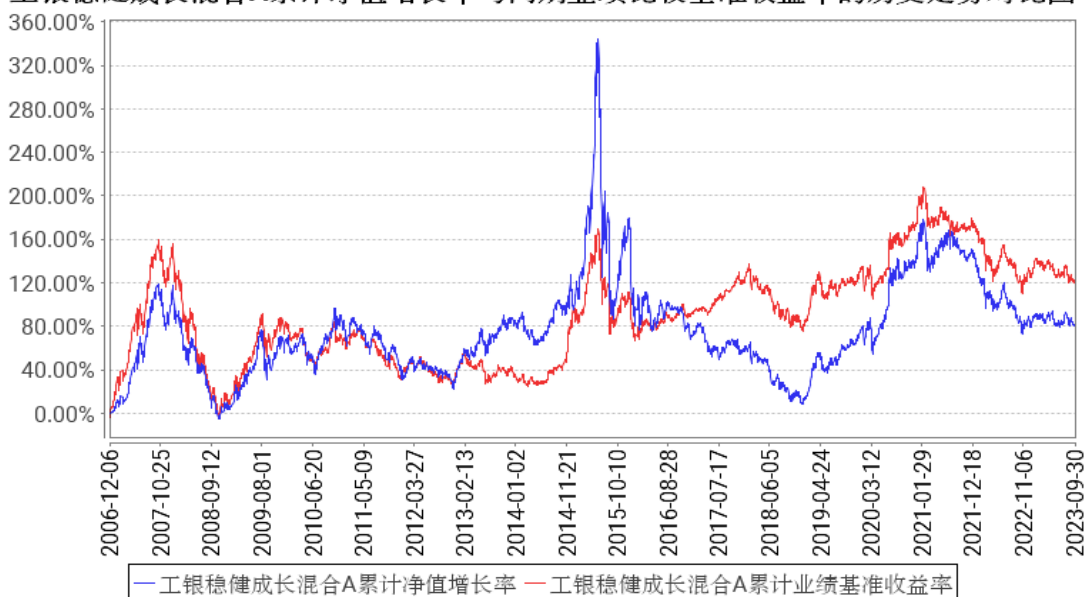
工银稳健成长混合A累计净值增长率与同期业绩比较基准收益率的历史走势对比图