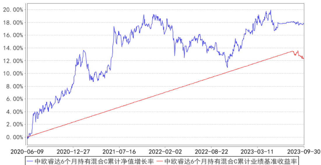
中欧睿达6个月持有混合C累计净值增长率与同期业绩比较基准收益率的历史走势对比图

注：2023 年 8 月 14 日起组合业绩比较基准变更为中债综合财富(总值)指数收益率*80%+沪深 300 指数收益率*17%+中证港股通综合指数(人民币)收益率*3%。本基金于 2020 年 6 月 5 日新增 C 份额，图示日期为 2020 年 6 月 9 日至 2023 年 09 月 30 日。