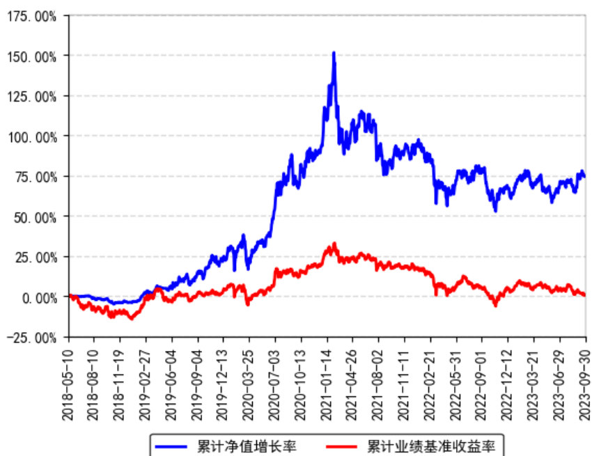
南方瑞祥一年定开灵活配置混合A累计净值增长率与同期业绩比较基准收益率的历史走势对比图