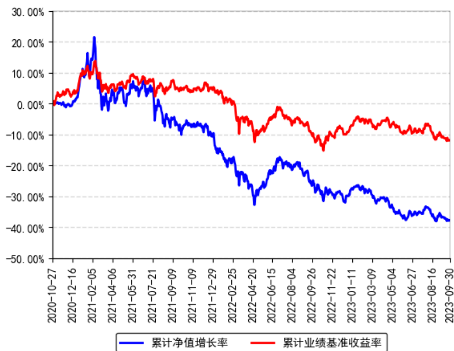
南方行业精选一年持有混合A累计净值增长率与同期业绩比较基准收益率的历史走势对比图