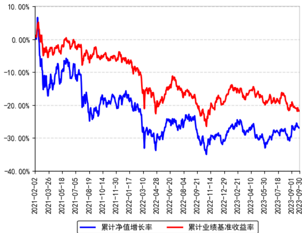
南方匠心优选股票A累计净值增长率与同期业绩比较基准收益率的历史走势对比图