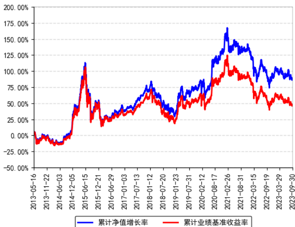
南方沪深300ETF联接A累计净值增长率与同期业绩比较基准收益率的历史走势对比图