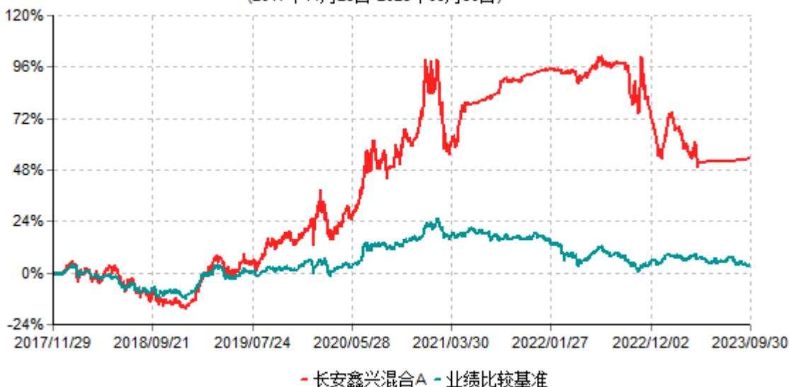
长安鑫兴混合A累计净值增长率与业绩比较基准收益率历史走势对比图 (2017年11月29日-2023年09月30日)

根据基金合同的规定,自基金合同生效之日起 6 个月内基金各项资产配置比例需符合基金合同要求。截止到建仓期结束时,本基金的各项投资组合比例已符合基金合同的相关规定。基金合同生效日至报告期期末,本基金运作时间已满一年。图示日期为 2017 年 11 月 29 日至 2023 年 9 月 30 日。