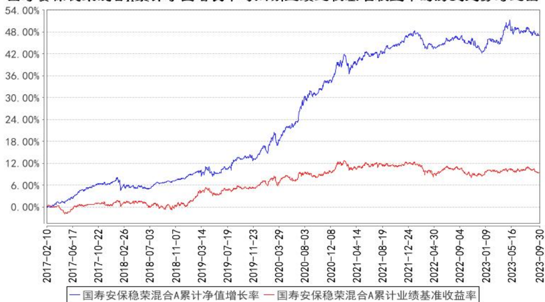
国寿安保稳荣混合A累计净值增长率与同期业绩比较基准收益率的历史走势对比图