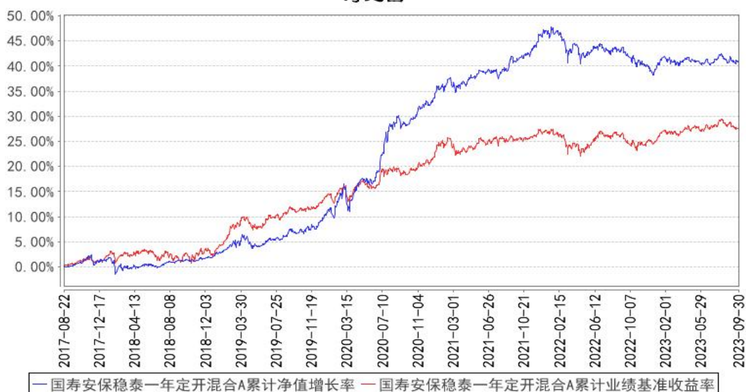
国寿安保稳泰一年定开混合A累计净值增长率与同期业绩比较基准收益率的历史走势对比图