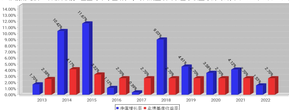
工银信用纯债一年定开债券C基金每年净值增长率与同期业绩比较基准收益率的对比图（2022年12月31日）

注：1、本基金基金合同于 2013 年 05 月 22 日生效。合同生效当年不满完整自然年度的，按实际期限计算净值增长率。