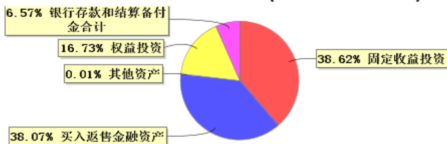
投资组合资产配置图表(2023年9月30日)

● 固定收益投资 ● 买入返售金融资产 ● 其他资产 ● 权益投资 ● 银行存款和结算备付金合计