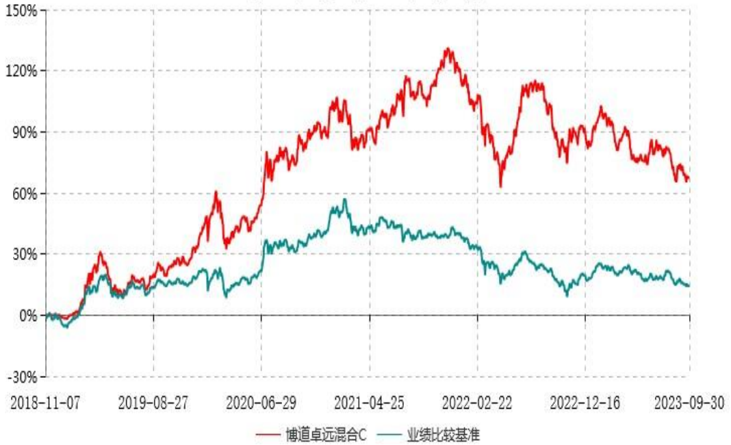
博道卓远混合C累计净值增长率与业绩比较基准收益率历史走势对比图 (2018年11月07日-2023年09月30日)

注：本基金建仓期为自基金合同生效日起的6个月。截至建仓期结束，本基金各项资产配置比例符合基金合同及招募说明书有关投资比例的约定。