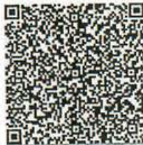
手机旁的年检二维码