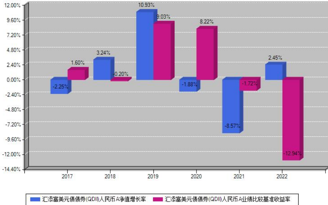
汇添富美元债债券(QDII)人民币A每年净值增长率与同期业绩基准收益率对比图

注：基金的过往业绩不代表未来表现。本《基金合同》生效之日为2017年04月20日，合同生效当年按实际存续期计算，不按整个自然年度进行折算。