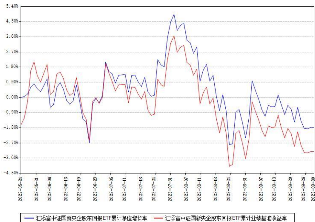
汇添富中证国新央企股东回报ETF累计净值增长率与同期业绩基准收益率对比图

(二) 自基金合同生效以来基金累计净值增长率变动及其与同期业绩比较基准收益率变动的比较图