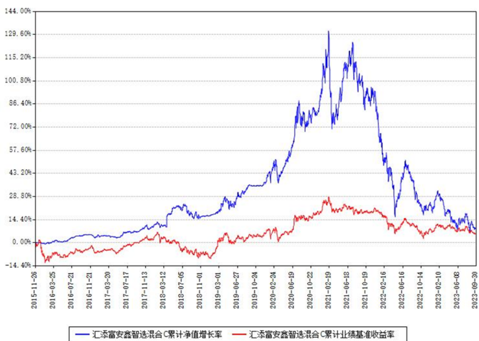
汇添富安鑫智选混合C累计净值增长率与同期业绩基准收益率对比图