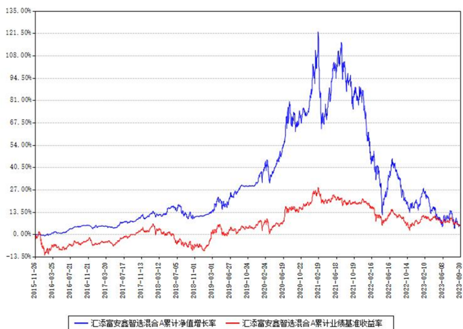
汇添富安鑫智选混合A累计净值增长率与同期业绩基准收益率对比图