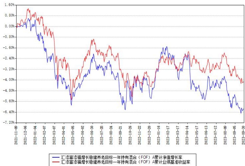
汇添富添福增长稳健养老目标一年持有混合（FOF）A累计净值增长率与同期业绩基准收益率对比图