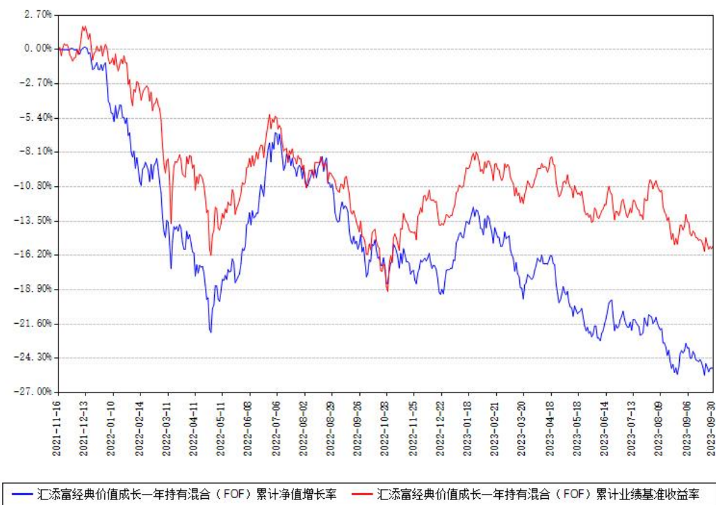
汇添富经典价值成长一年持有混合（FOF）累计净值增长率与同期业绩基准收益率对比图