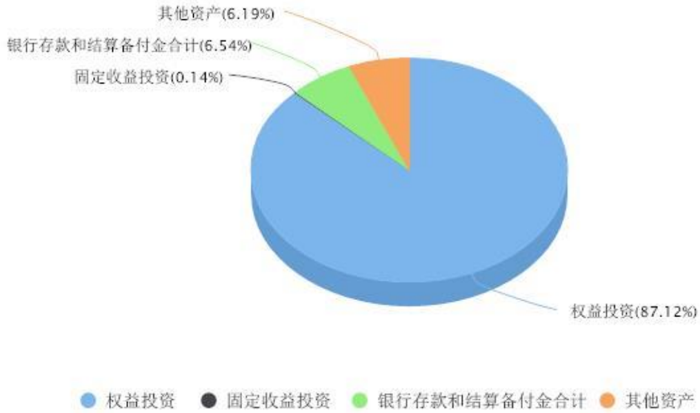
投资组合资产配置图表 数据截止日期:2023年06月30日