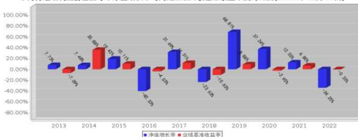
中海分红增利混合基金每年净值增长率与同期业绩比较基准收益率的对比图(2022年12月31日)

注:业绩表现截止日期 2022 年 12 月 31 日。基金过往业绩不代表未来表现。