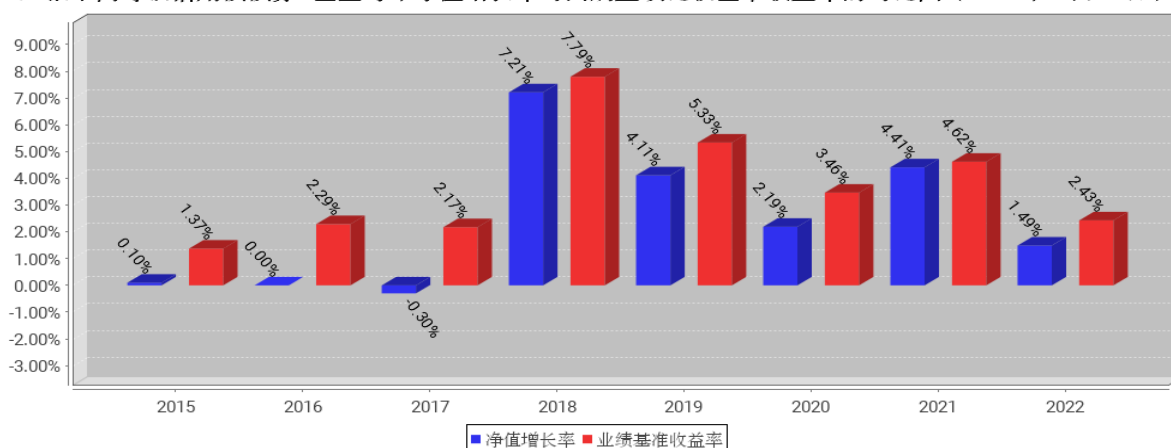
工银中高等级信用债债券B基金每年净值增长率与同期业绩比较基准收益率的对比图（2022年12月31日）

注：1、本基金基金合同于 2015 年 12 月 02 日生效。合同生效当年不满完整自然年度的，按实际期限计算净值增长率。