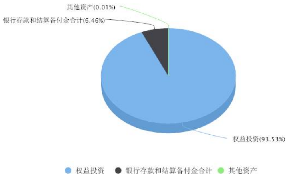
投资组合资产配置图表 数据截止日期:2022年12月31日