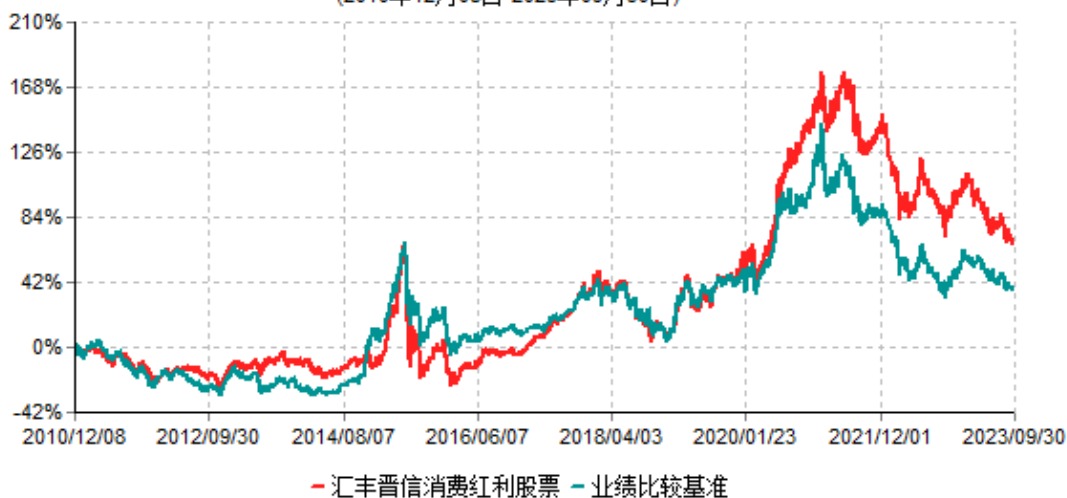
汇丰晋信消费红利股票型证券投资基金累计净值增长率与业绩比较基准收益率历史走势对比图 (2010年12月08日-2023年09月30日)

注：1.按照基金合同的约定，本基金的投资组合比例为：股票投资比例范围为基金资产的85%-95%，权证投资比例范围为基金资产净值的0%-3%。固定收益类证券、现金和其他资产投资比例范围为基金资产的5%-15%，其中现金（不包括结算备付金、存出保证金、应收申购款等）或到期日在一年以内的政府债券的投资比例不低于基金资产净值的5%。按照基金合同的约定，本基金自基金合同生效日起不超过6个月内完成建仓，截止2011年6月8日，本基金的各项投资比例已达到基金合同约定的比例。