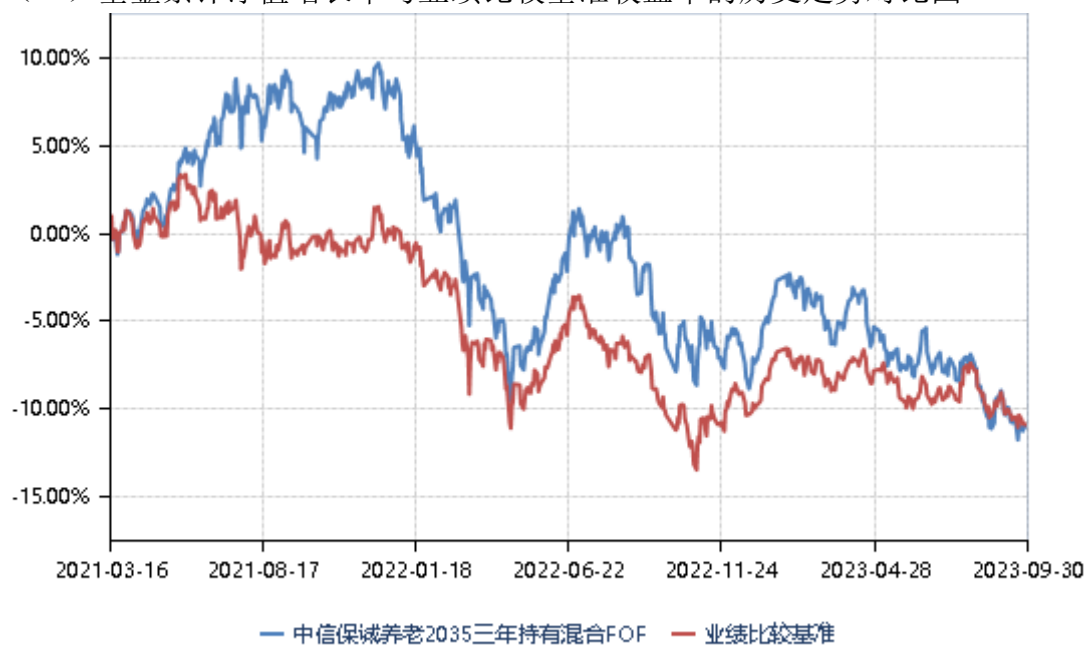
（二）基金累计净值增长率与业绩比较基准收益率的历史走势对比图