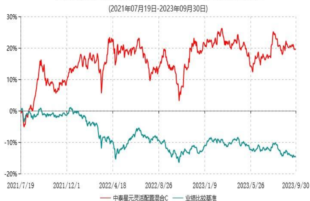
中泰星元灵活配置混合C累计净值增长率与业绩比较基准收益率历史走势对比图