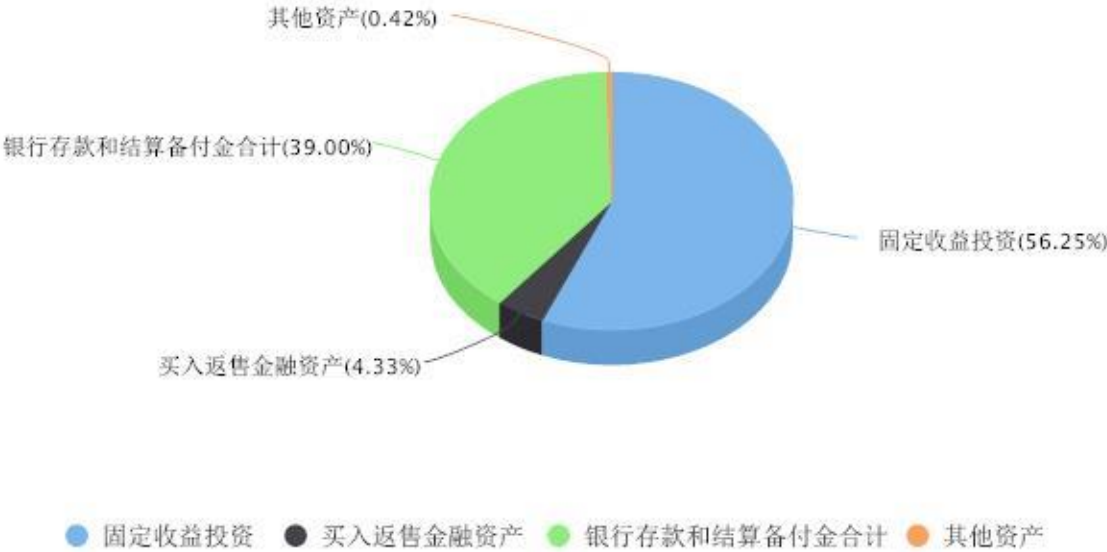
投资组合资产配置图表 数据截止日期:2023年09月30日