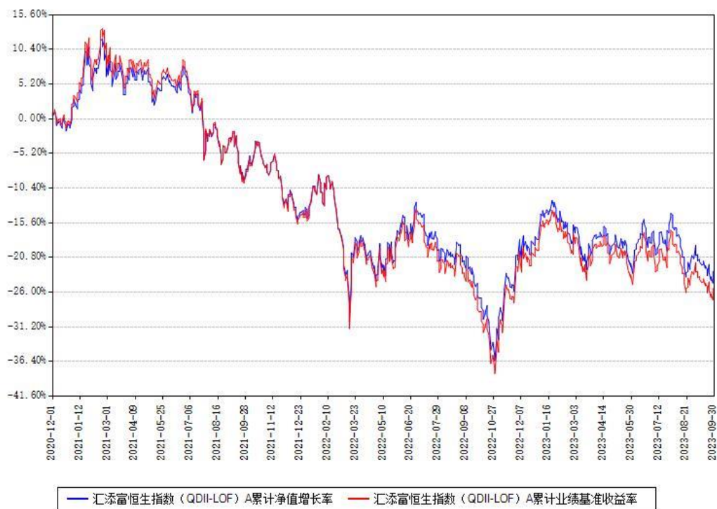
汇添富恒生指数 (QDII-LOF) A 累计净值增长率与同期业绩基准收益率对比图