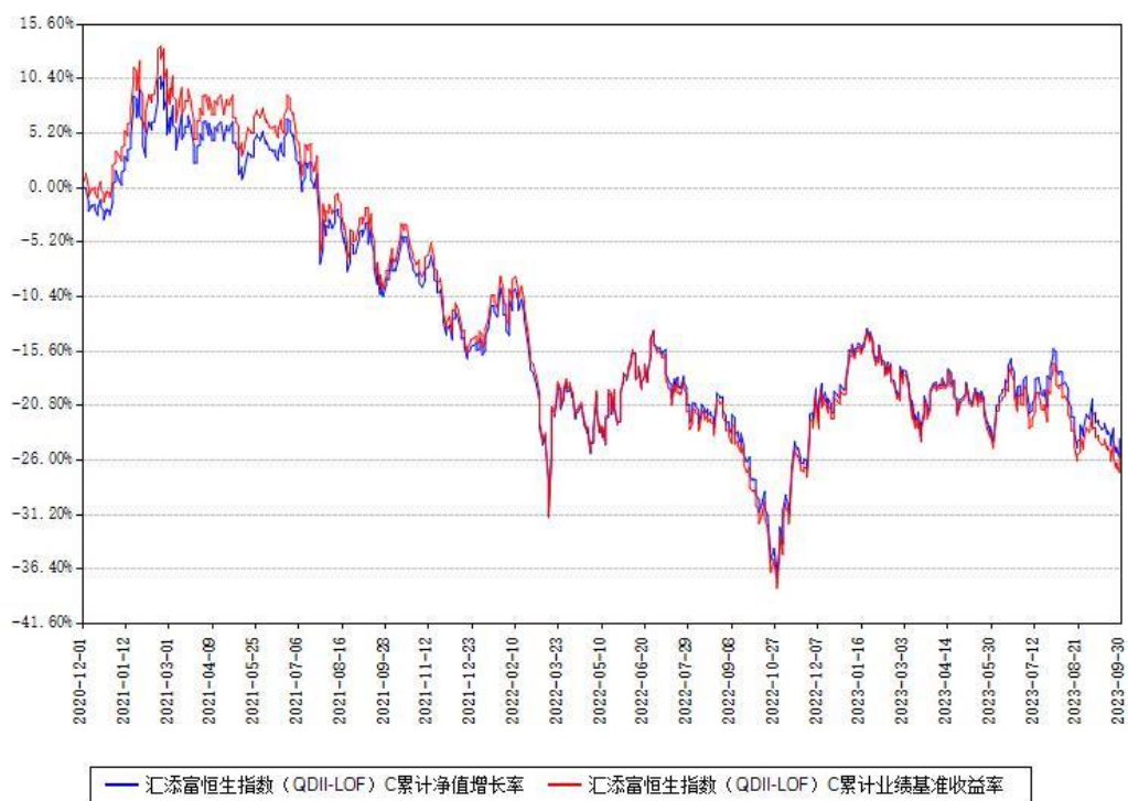
汇添富恒生指数 (QDII-LOF) C 累计净值增长率与同期业绩基准收益率对比图