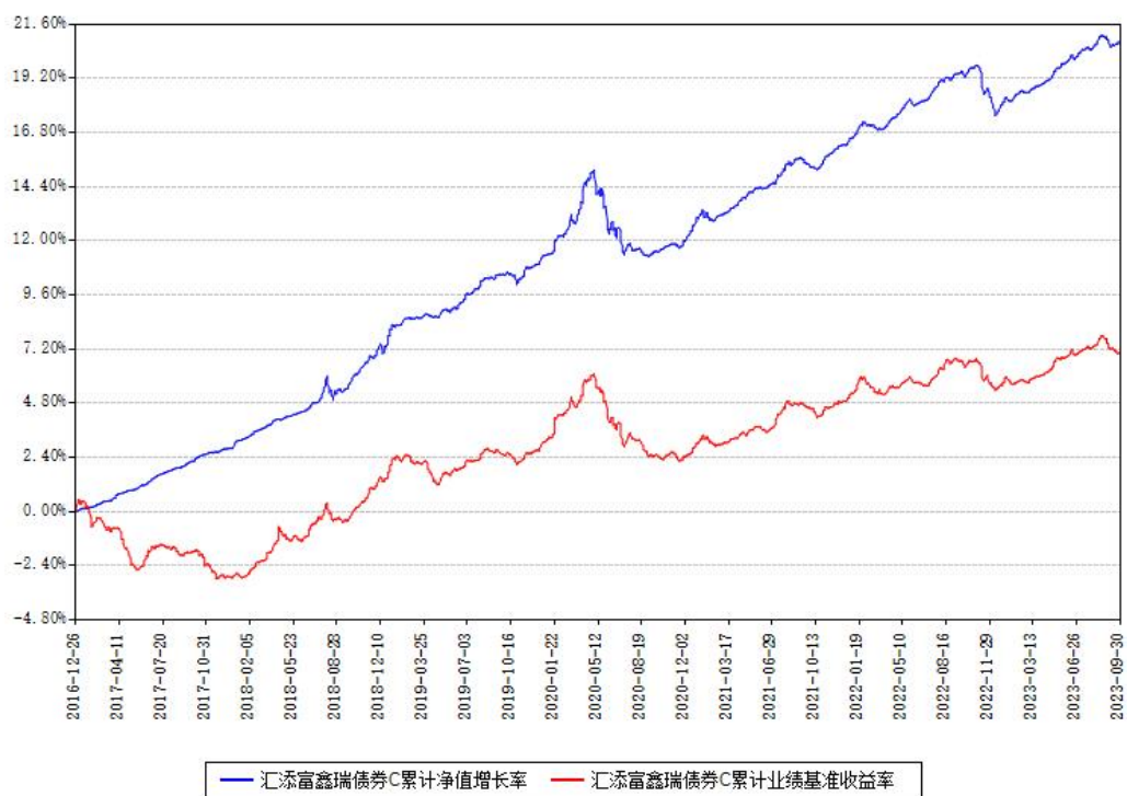
汇添富鑫瑞债券C累计净值增长率与同期业绩基准收益率对比图