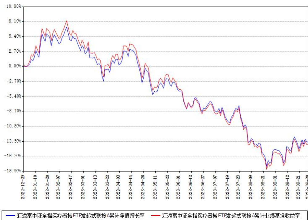
汇添富中证全指医疗器械ETF发起式联接A累计净值增长率与同期业绩基准收益率对比图