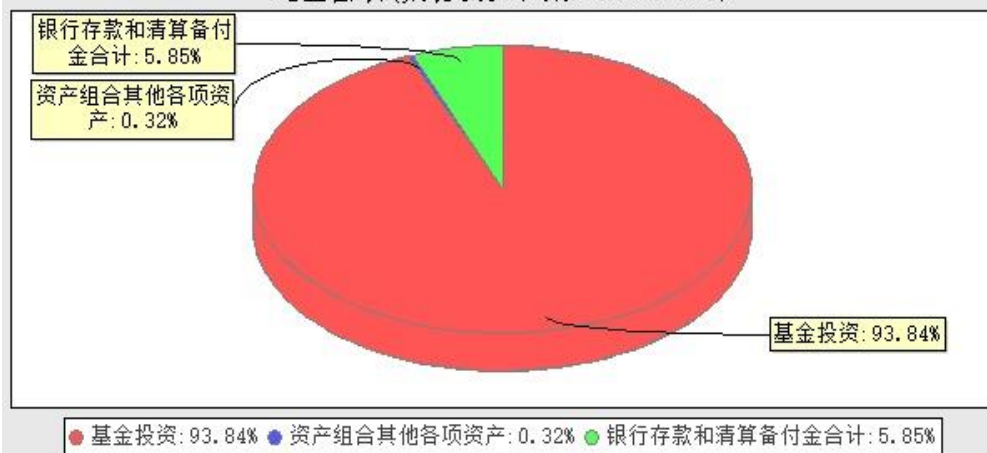
华宝中证科技龙头交易型开放式指数证券投资基金发起式联接基金投资组合资产配置图表(数据截止日期: 20230930)