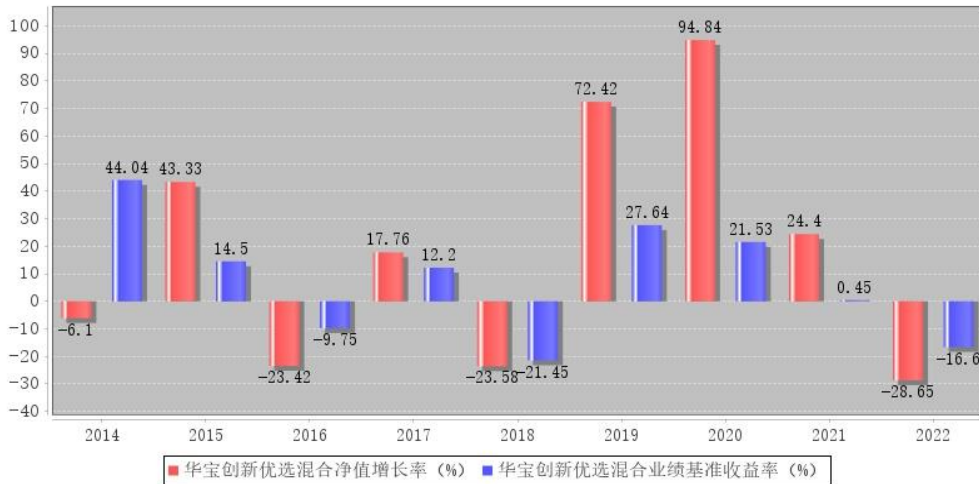
华宝创新优选混合每年净值增长率与同期业绩比较基准收益率的对比图