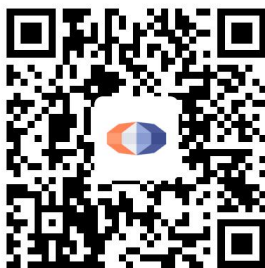
国泰君安资管 APP 下载二维码

投资者可以在应用市场搜索“国泰君安资管”，或者扫描下方二维码，下载国泰君安资管 APP，了解基金产品、服务等信息。