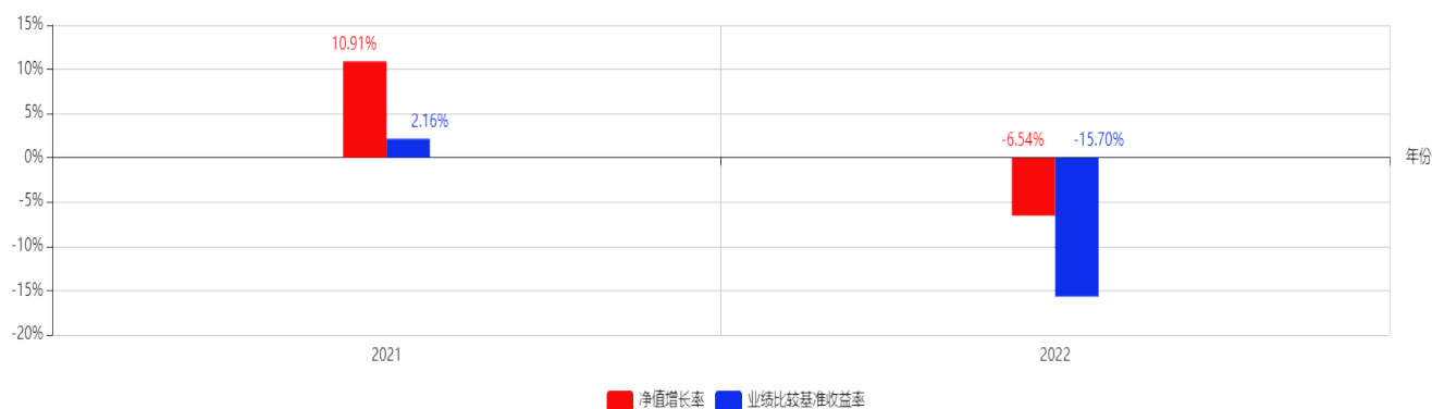
基金每年的净值增长率及与同期业绩比较基准的比较图