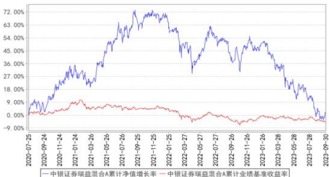
中银证券瑞益混合A累计净值增长率与同期业绩比较基准收益率的历史走势对比图