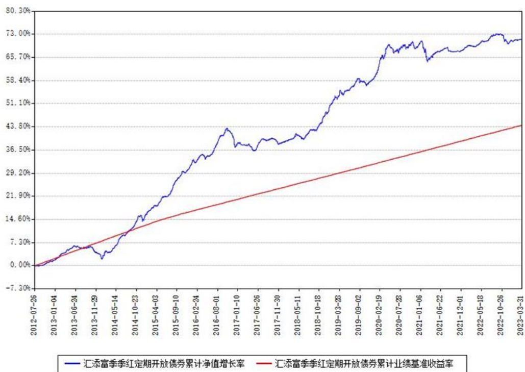
汇添富季季红定期开放债券累计净值增长率与同期业绩基准收益率对比图