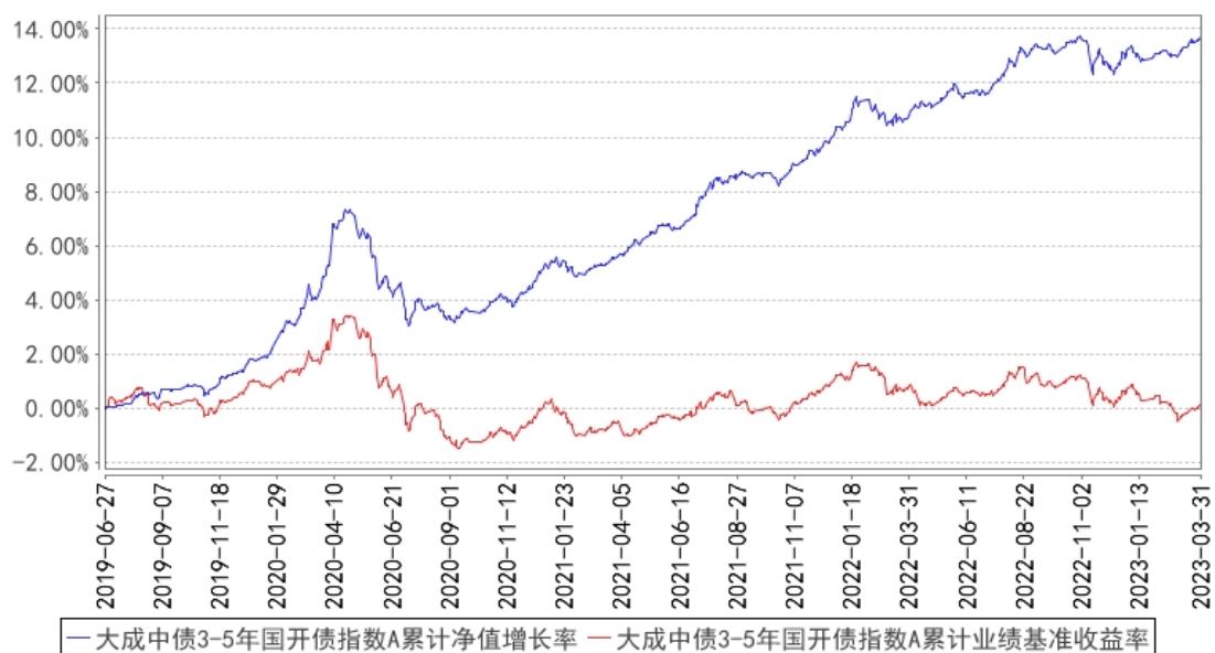
大成中债3-5年国开债指数A累计净值增长率与同期业绩比较基准收益率的历史走势对比图

(二) 自基金合同生效以来基金份额累计净值增长率变动及其与同期业绩比较基准收益率变动的比较