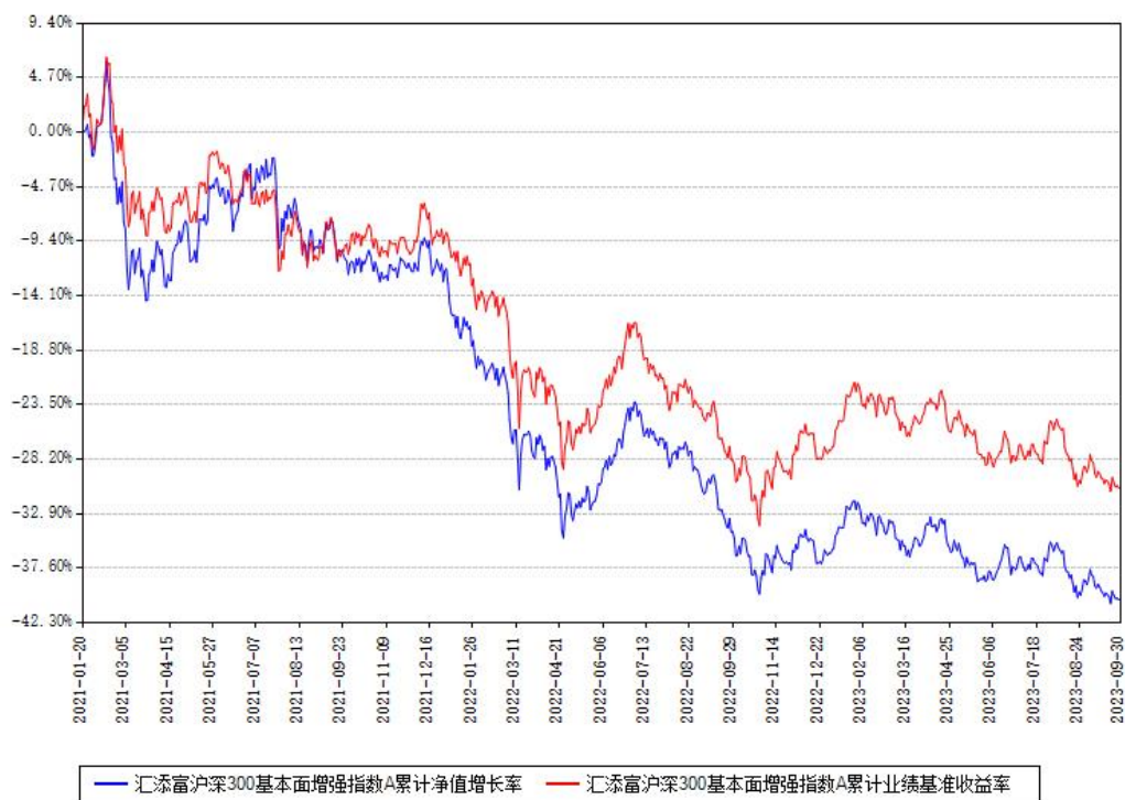
汇添富沪深300基本面增强指数A累计净值增长率与同期业绩基准收益率对比图