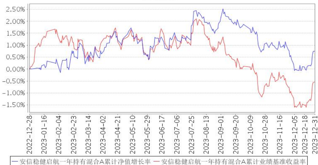
安信稳健启航一年持有混合A累计净值增长率与同期业绩比较基准收益率的历史走势对比图