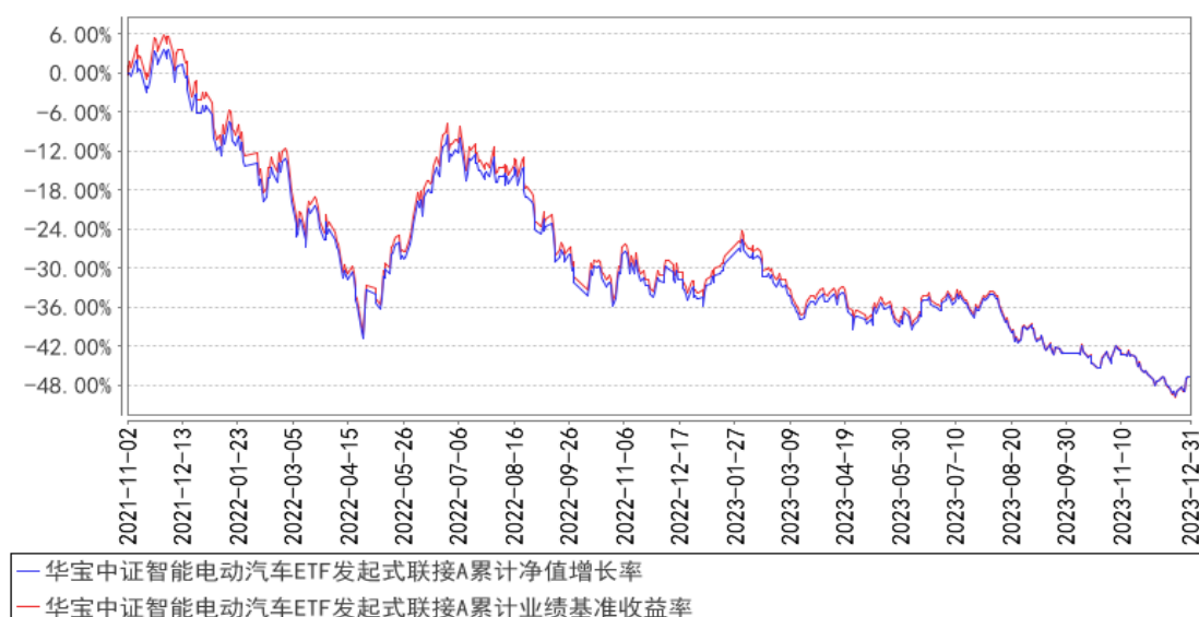
华宝中证智能电动汽车ETF发起式联接A累计净值增长率与同期业绩比较基准收益率的历史走势对比图