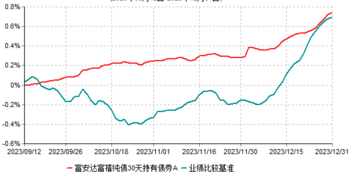
富安达富禧纯债30天持有债券A累计净值增长率与业绩比较基准收益率历史走势对比图 (2023年09月12日-2023年12月31日)