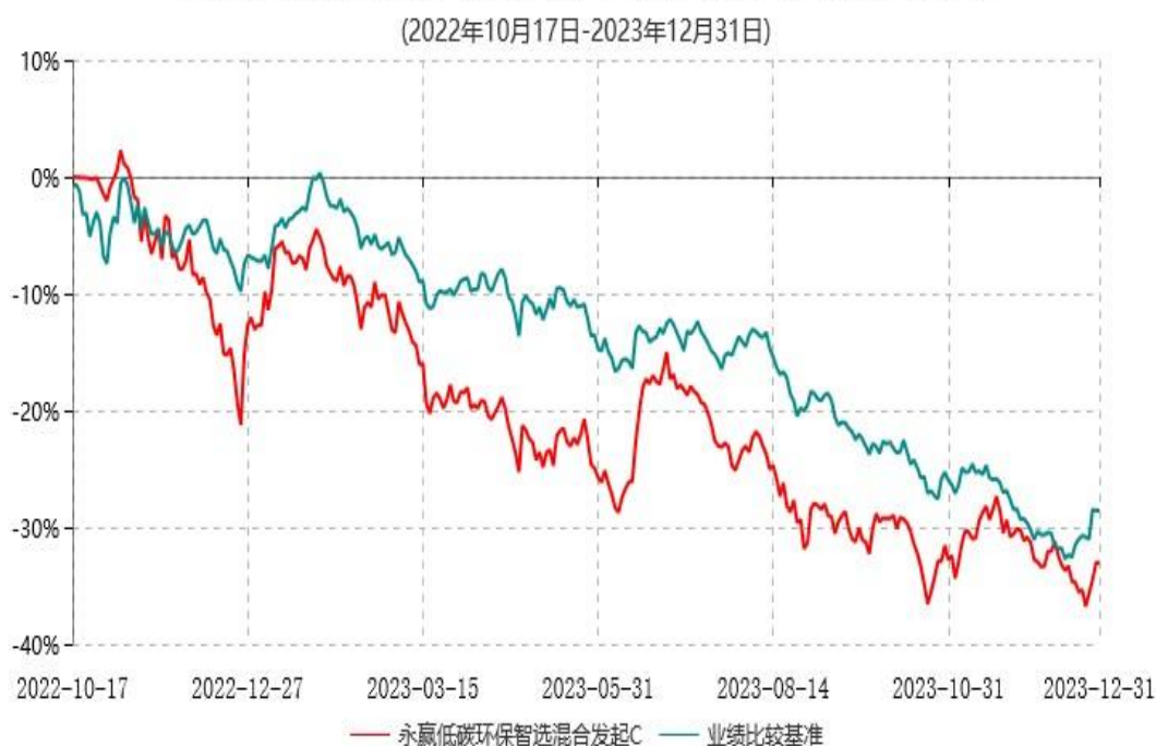
永赢低碳环保智选混合发起C累计净值增长率与业绩比较基准收益率历史走势对比图