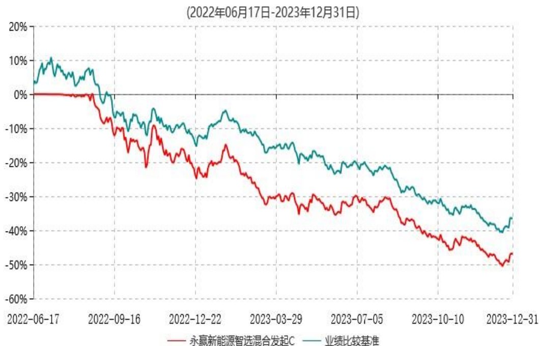
永赢新能源智选混合发起C累计净值增长率与业绩比较基准收益率历史走势对比图