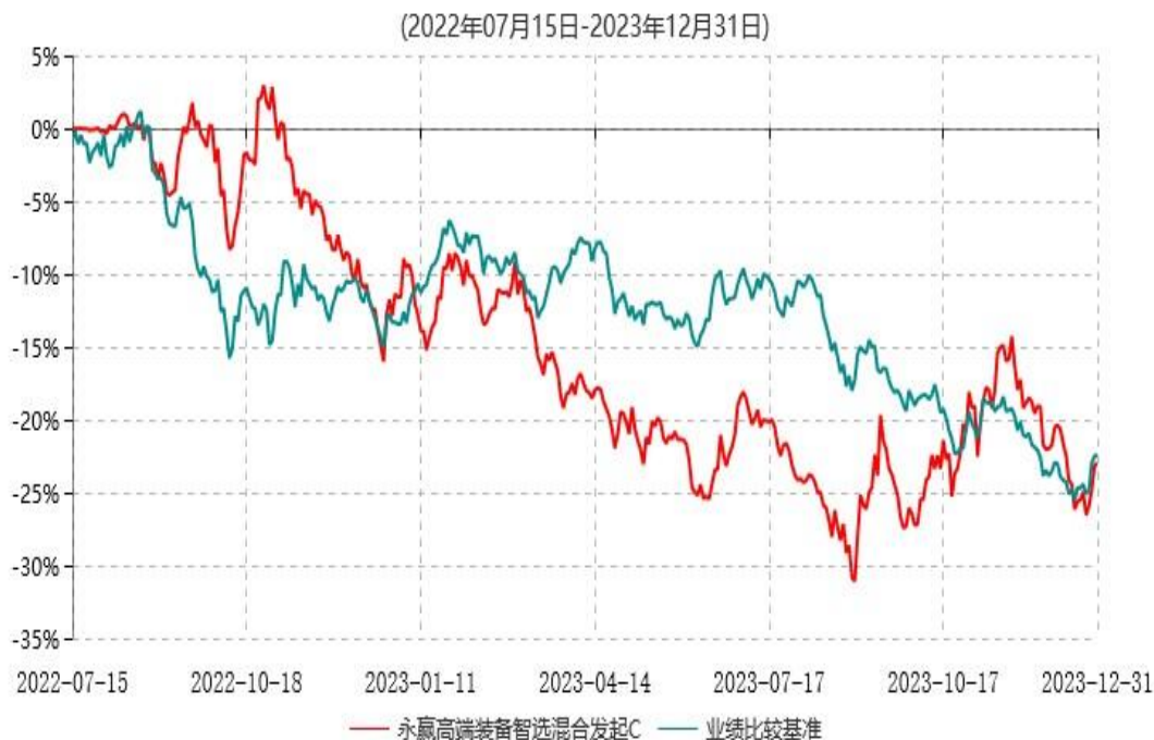
永赢高端装备智选混合发起C累计净值增长率与业绩比较基准收益率历史走势对比图