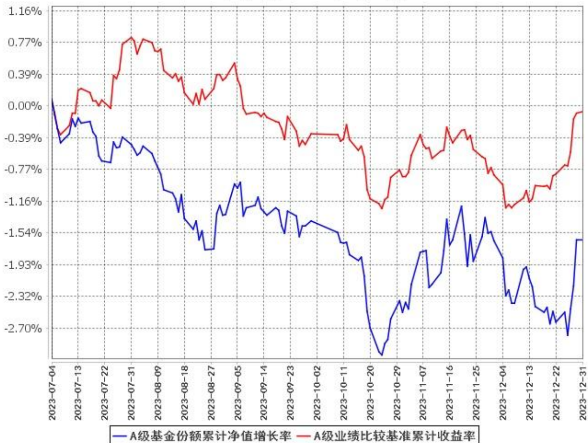
A级基金份额累计净值增长率与同期业绩比较基准收益率的历史走势对比图 (2023年7月4日至2023年12月31日)