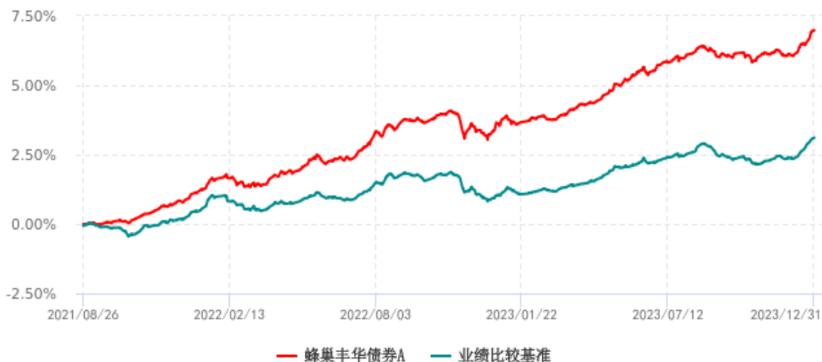
蜂巢丰华债券A累计净值增长率与业绩比较基准收益率历史走势对比图 (2021年08月26日-2023年12月31日)